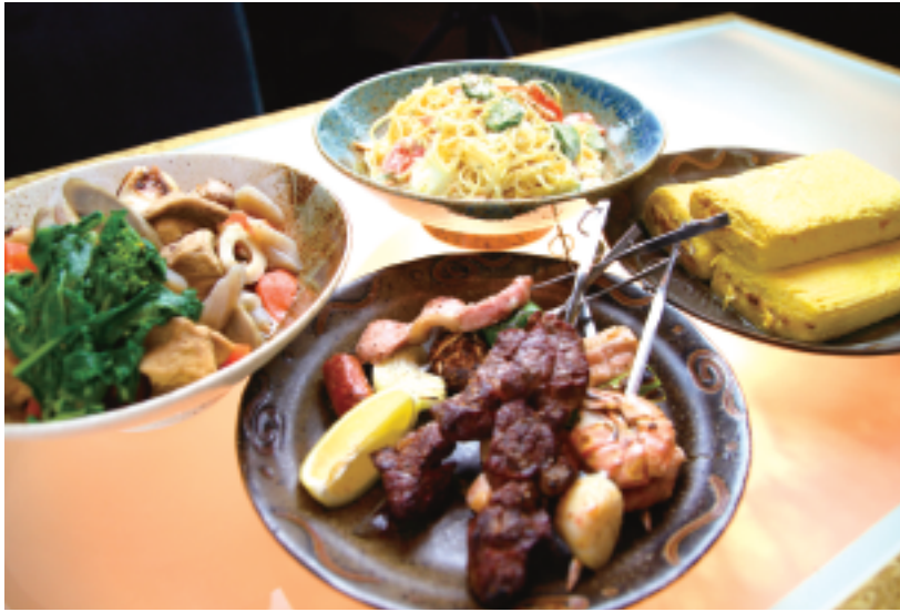
おまかせのコースは1,500円～。お腹一杯になると評判だ。