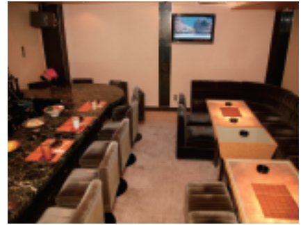
もちろん普通のスナックのようにカラオケなども楽しめる。