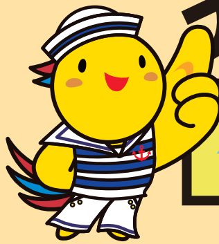
兵庫県マスコットはばタン