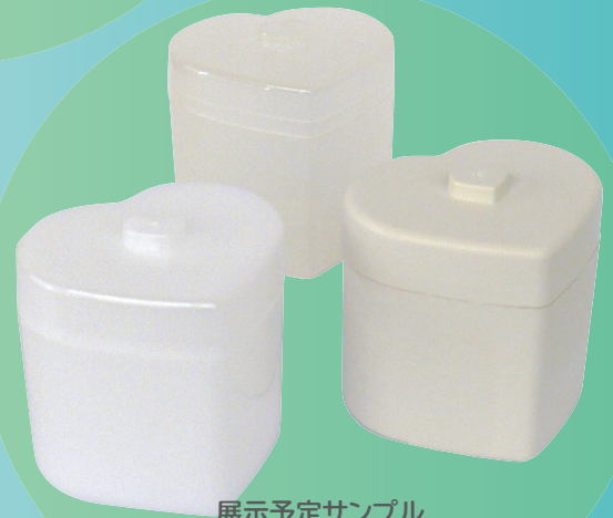
展示予定サンプル

バイオプラスチックとは、バイオマスプラスチックと生分解性プラスチックの総称です。環境問題で注目されているバイオプラスチックを使用しサンプルをご準備致しました。是非、各サンプルを見比べてみて下さい。