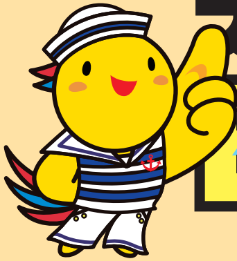
兵庫県マスコットはばタン